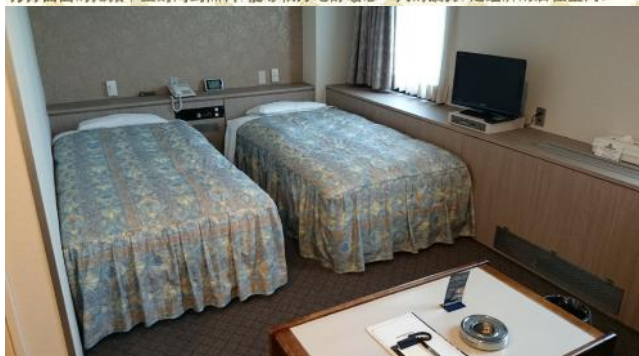
雙床房 TA(¥13,000-) TB(¥14,000-)