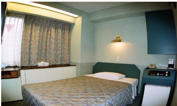
單人房 SA(¥8,100-) SB(¥9,200-)