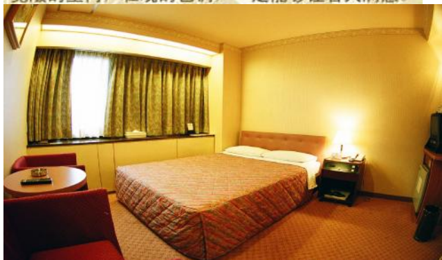
雙人大床房 Double Room (¥13,000-)